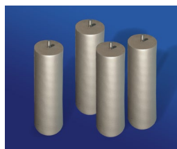
4 Füße, buche hell, silber lackiert, 20 oder 25 cm